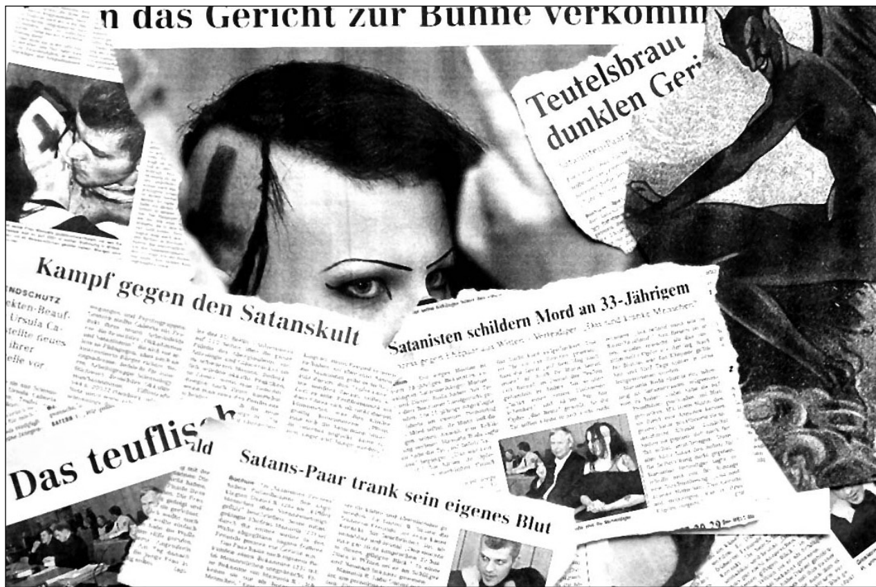
Der Fall Ruda bestimmte tagelang die Schlagzeilen im deutschen Blätterwald und rückte das Thema Satanismus und Teufel verstärkt ins Interesse der Öffentlichkeit. Collage: Will-Bruhn – Ausrisse aus Die Welt, Hamburger Abendblatt, Harburger Anzeigen und Nachrichten, PM

Auch ist Satanismus kein schichtenspezifisches Problem. „Es gibt für jede Schicht und für jeden Geschmack die geeignete Gruppe“, sagt Ingolf Christiansen. So beispielsweise Gruppierungen, die altersmäßig alles umfassen – vom Kleinkind bis zum Greis. Oder intellektuelle Gruppen, in denen überwiegend Akademiker zusammentreffen. Psychotische Satanisten wiederum gelten als Einzelgänger, die Rituale alleine oder im klei-